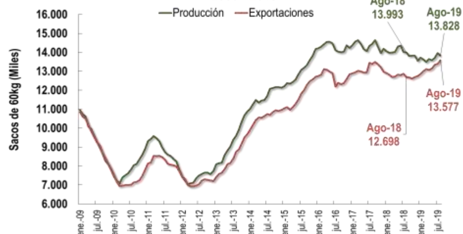
Producción vs. Exportaciones - Acumulado 12 meses 2009 - 2019