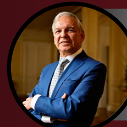
Ricardo Bonilla González Ministro de Hacienda y Crédito Público de Colombia

Disrupción digital. Transformarse o desaparecer