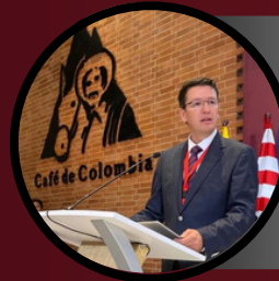
German Bahamón Gerente General Federación Nacional de Cafeteros