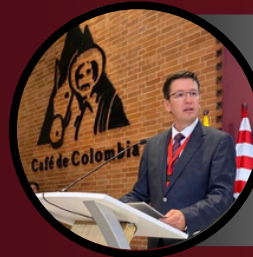
German Bahamón Gerente General Federación Nacional de Cafeteros