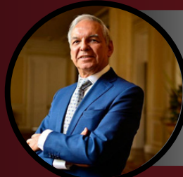
Ricardo Bonilla González Ministro de Hacienda y Crédito Público de Colombia